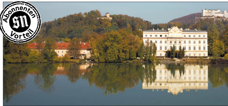
Schloss Leopoldskron kann am Sonntag, den 25. November von 13 bis 19 Uhr besichtigt werden. Bild: SN

bäckereien enthält dieses Werk 30 weitere Gerichte, die bei den Trapps regelmäßig auf den Tisch kamen. Der Buchtitel lehnt sich bewusst am Kino-Welterfolg „The Sound of Music“ an, der 1964 in Salzburg gedreht wurde und der Lebensgeschichte der Familie Trapp gewidmet ist.